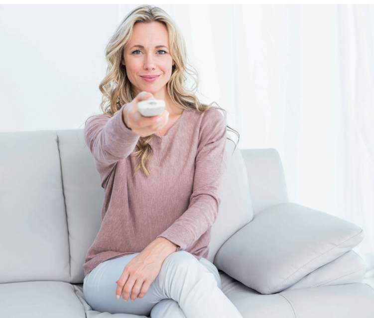
Einfach mehr Spaß mit Digital-Fernsehen!

Fernsehen Die Umstellung von Analog- auf Digital-Fernsehen hat klare technische Gründe und schafft viele neue Möglichkeiten.