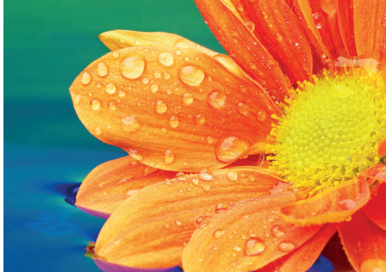
Bild ist nicht gleich Bild. Links ein Annäherungswert an das „alte“ analoge Bild, rechts an digitale Bildqualität.