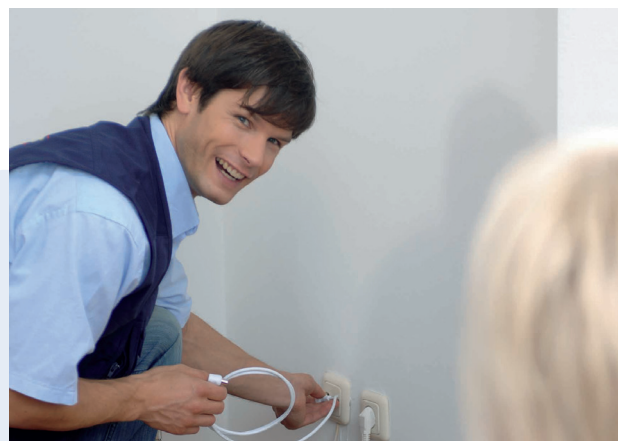
Die Profis von LIWEST helfen persönlich.