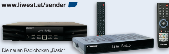
Die neuen Radioboxen „Basic“ und „Premium“