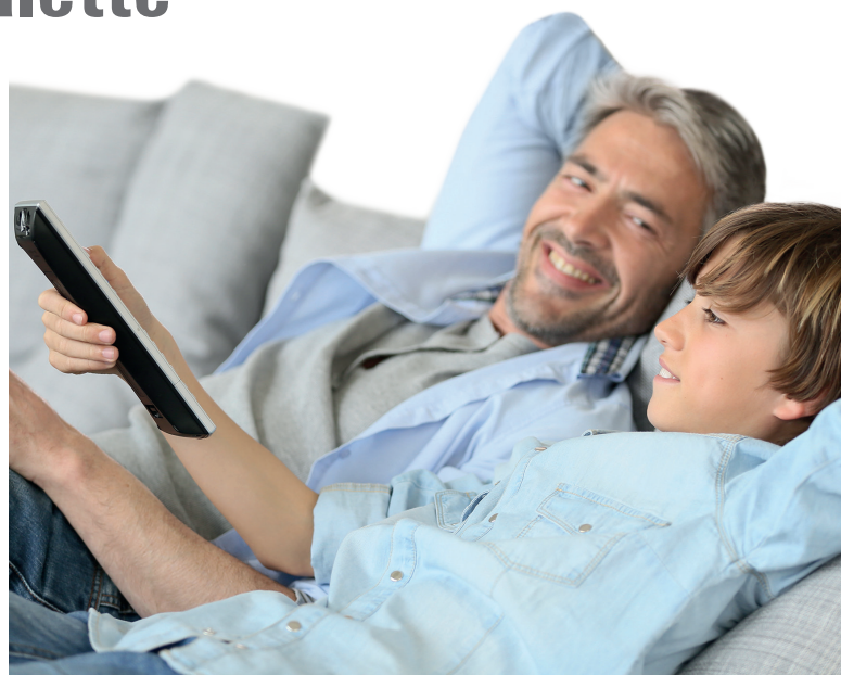
Die TV-Angebote von LIWEST beinhalten Sender für jede Generation und jeden Geschmack.

Immer dabei sind natürlich die thematisch vielsei-